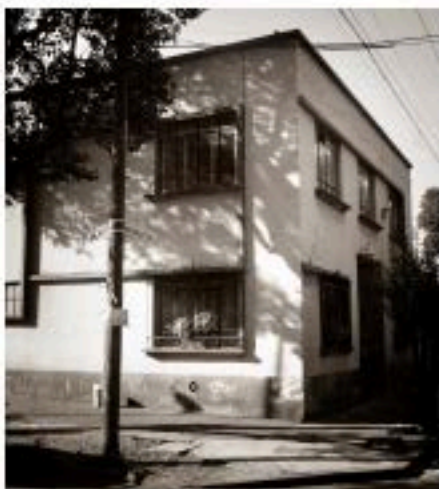
2ª SEDE DEL CMF Nautla y Tlaxcala / Colonia Roma Planta baja

Lo inesperado del lanzamiento obligó a que los objetos patrimoniales del CMF fueran trasladados a la planta baja de una pequeña casa en la Calle de Nautla de la misma Colonia Roma. Esta pequeña casa, de un piso, era muy reducida; apenas suficiente para guardar los muebles, libros y demás cosas del consejo; o para celebrar ocasionalmente algunas reuniones pequeñas en torno a la misma mesa que en otras épocas se había sido el escenario de las reuniones de los jueves . Recordando esta etapa del Consejo, Armando Cristeto (CRISTETO 08. 2012) 3 https://www.youtube.com/watch?v=dio7cDggoEg&feature=youtu.be considera que a partir del desalojo de la Casa de la Fotografía, de la creación del Consejo Nacional de las Artes y del nombramiento de Pablo Ortiz Monasterio como coordinador de los festejos de los 150 años de la fotografía, la Bienal de Fotoperiodismo fue un logro importante. Para él, con la alianza del Centro de la Imagen, la bienal permaneció a lo largo de seis emisiones a pesar de la conclusión del CMF.